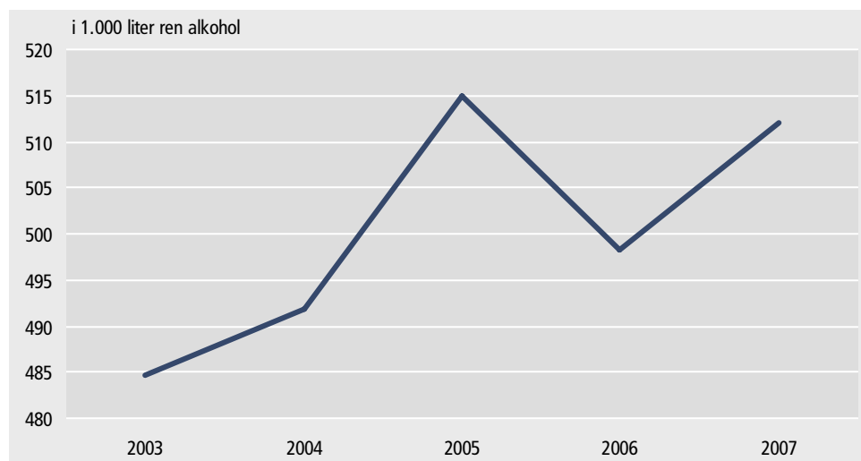
Figur 1 Indførsel af ren alkohol

Der blev i 2007 indført ca. 511.800 liter ren alkohol i drikkevarer, jf. Figur 1. I forhold til året før steg indførelsen med ca. 14.000 liter, eller 2,7 pct. Indførelsen af alkohol er dermed igen stigende, efter at have haft et lille fald fra 2005 til 2006. Den største stigning har igen været i indførelsen af vin, som steg med 9,5 pct.